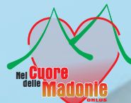
"Nel cuore delle Madonie" onlus