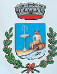
Comune di Gangi